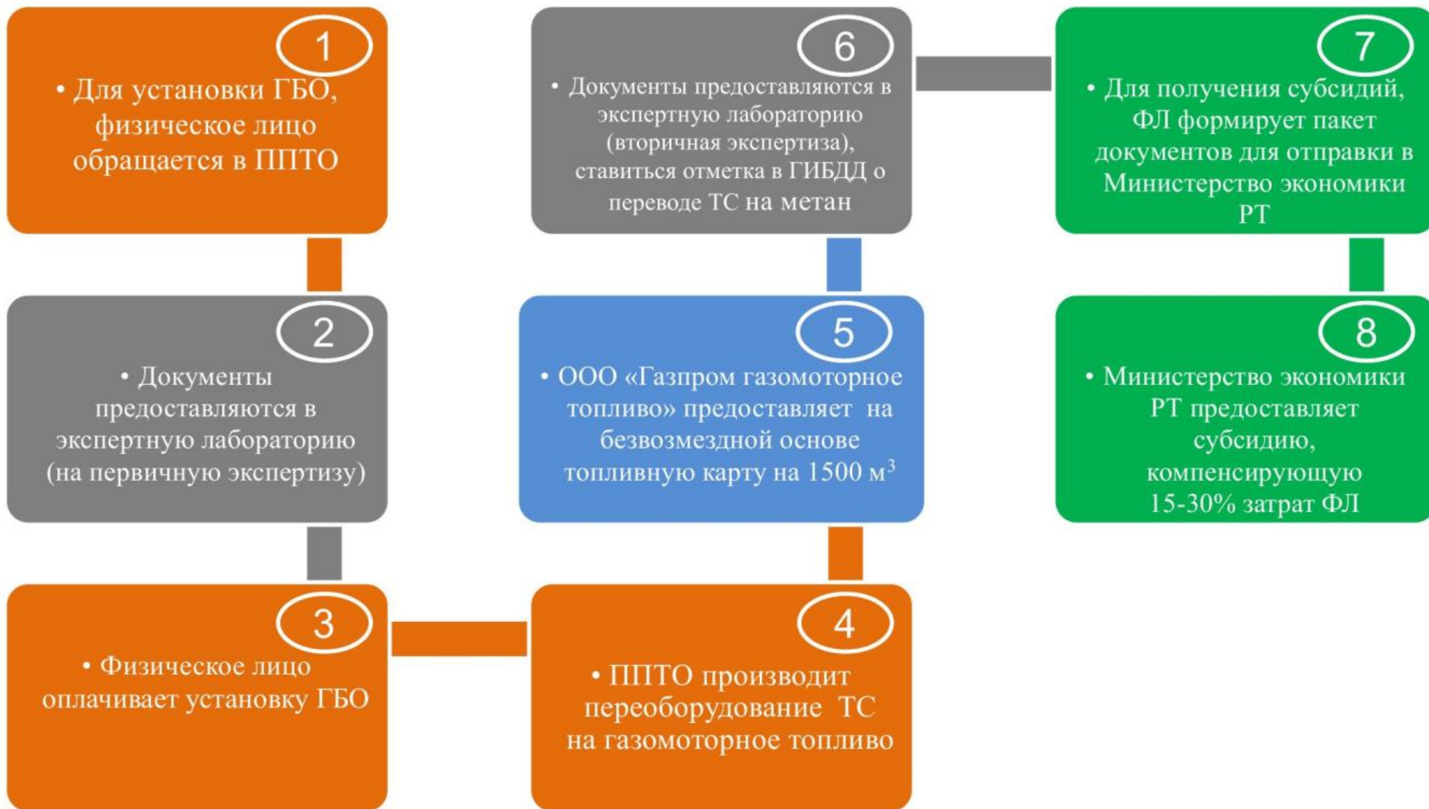
Схема переоборудования ТС на использование ГМТ (метан) для Физических лиц